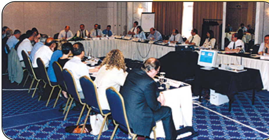
Η Επιτροπή Πιστοποίησης της ΕΑ κατά την πρόσφατη συνεδρίασή της, που οργανώθηκε από το ΕΣΥΔ στην Αθήνα.

Εάνταπόκριση σχετικής αίτησης του ΕΣΥΔ, η «Ευρωπαϊκή συνεργασία για τη Διαπίστευση - ΕΑ» προχώρησε στη δρομολόγηση της διαδικασίας της αξιολόγησης του Εθνικού Συστήματος Διαπίστευσης, με την προοπτική της έναρξης του στην πολυμερή συμφωνία αμοιβαίας αναγνώρισης (Multilateral Agreement - MLA), μεταξύ των ευρωπαϊκών εθνικών οργανισμών διαπίστευσης. Η φάση της προ-αξιολόγησης προβλέπει και επιτόπιες επιθεωρήσεις στα γραφεία του ΕΣΥΔ και σε διαπιστευμένους φορείς, οι οποίες έχουν προγραμματισθεί για το τέλος Οκτωβρίου 2002.